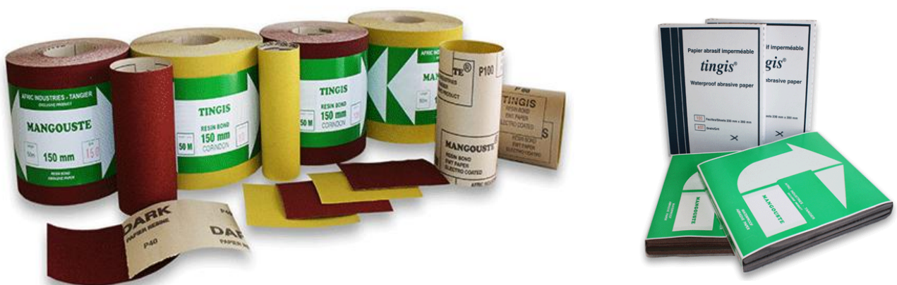
FIGURE 1 : PRODUITS ABRASIFS COMMERCIALISÉS PAR AFRIC INDUSTRIES S.A.