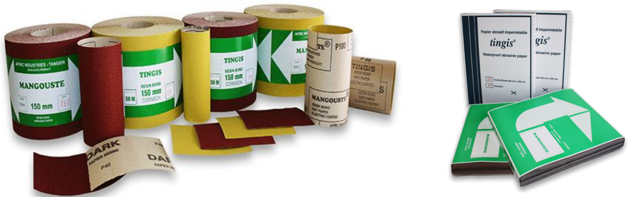
FIGURE 1 : PRODUITS ABRASIFS COMMERCIALISÉS PAR AFRIC INDUSTRIES S.A.